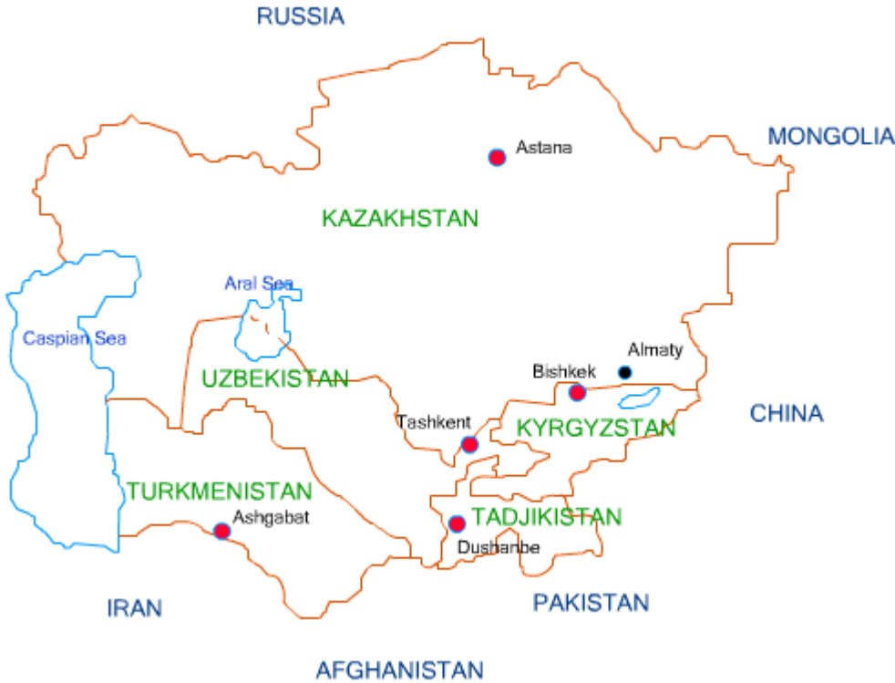
Abb. 2: Seidenstraße

http://www.advantour.com/de/zentralasien/karte.htm